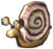
Sam die Schnecke

Bugdom 2 ist ein Action-Adventure-Spiel, in welchem Sie Feinde besiegen müssen und außerdem mit anderen Charakteren interagieren müssen, um Aufgaben zu bewältigen, um die Levels zu gewinnen. Die beiden Haupt-Charaktere die Skip durch jedes Level helfen werden, sind Sam die Schnecke und Sally das Eichhörnchen: