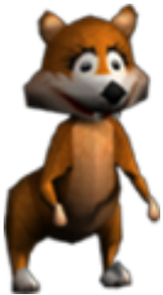
Sally das Eichhörnchen

Sie werden Sam in fast jedem Level treffen, gehen Sie einfach zu ihm hin und er wird Ihnen sagen, wie er Ihnen helfen kann und was Sie dafür für ihn machen müssen. Wenn Sie eine Aufgabe für Sam erledigt haben, suchen Sie ihn wieder auf und er wird Ihnen entweder weitere Hinweise geben oder Ihnen einen Schlüssel geben, falls Sie die Aufgabe bewältigt haben.